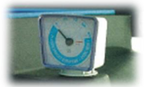
Indicador de nível

Na abertura está colocada uma grelha amovível para escoar os filtros ou latas de óleos usados, o que facilita a utilização.