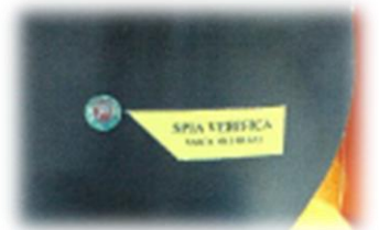
Visor de derrames

Reservatório com dupla parede em Polietileno de alta densidade.